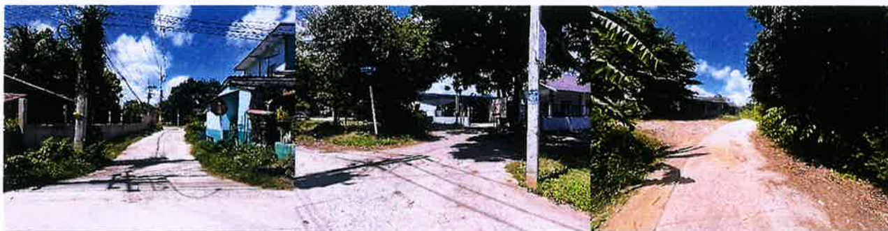
ระหว่างดำเนินงาน

งบประมาณ ๕๘๙,๐๐๐ บาท ระยะเวลาดำเนินการก่อสร้าง วันที่ ๑๑ เมษายน ๒๕๖๘ ถึงวันที่ ๙ มิถุนายน ๒๕๖๘ ณ.ชุมชนบ้านแหลมมะขาม หมู่ที่ ๒ ตำบลทับมา อำเภอเมืองระยอง จังหวัดระยอง โดยใช้งบประมาณ ๕๖๔,๖๐๐ บาท ก่อนดำเนินงาน