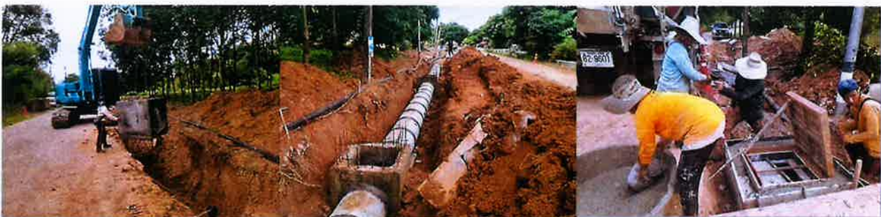
ดำเนินงานแล้วเสร็จ