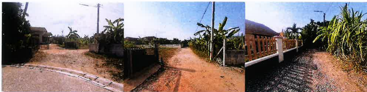
ระหว่างดำเนินงาน

งบประมาณ ๓๒๑,๐๐๐ บาท ระยะเวลาดำเนินการก่อสร้าง วันที่ ๒๘ มกราคม ๒๕๖๘ ถึงวันที่ ๒๘ มีนาคม ๒๕๖๘ ณ.ชุมชนบ้านขนาบ หมู่ที่ ๑ ตำบลทับมา อำเภอเมืองระยอง จังหวัดระยอง โดยใช้งบประมาณ ๒๖๗,๐๐๐ บาท ก่อนดำเนินงาน