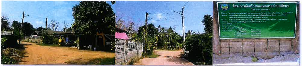
ระหว่างดำเนินงาน

งบประมาณ ๘๖,๐๐๐ บาท ระยะเวลาดำเนินการก่อสร้าง วันที่ ๒๘ มกราคม ๒๕๖๘ ถึงวันที่ ๒๘ มีนาคม ๒๕๖๘ ณ.ชุมชนบ้านทับมา หมู่ที่ ๔ ตำบลทับมา อำเภอเมืองระยอง จังหวัดระยอง โดยใช้งบประมาณ ๘๖,๐๐๐ บาท ก่อนดำเนินงาน