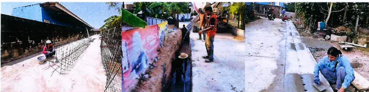
ดำเนินงานแล้วเสร็จ