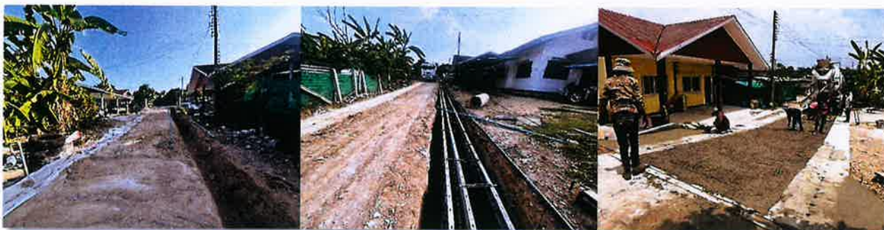
ดำเนินงานแล้วเสร็จ