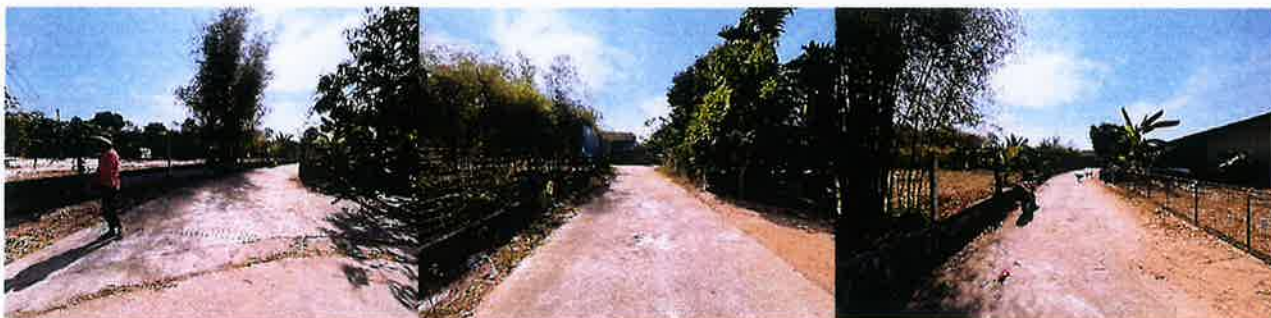
ระหว่างดำเนินงาน

งบประมาณ ๒๐๕,๐๐๐ บาท ระยะเวลาดำเนินการก่อสร้าง วันที่ ๑๑ กุมภาพันธ์ ๒๕๖๘ ถึงวันที่ ๑๑ เมษายน ๒๕๖๘ ณ.ชุมชนบ้านขนาบ หมู่ที่ ๑ ตำบลทับมา อำเภอเมืองระยอง จังหวัดระยอง โดยใช้งบประมาณ ๑๘๒,๐๐๐ บาท ก่อนดำเนินงาน