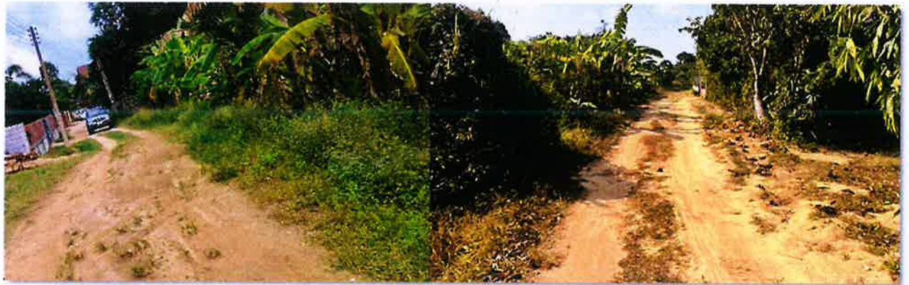
ระหว่างดำเนินงาน

งบประมาณ ๔๔๘,๐๐๐ บาท ระยะเวลาดำเนินการก่อสร้าง วันที่ ๒๘ มกราคม ๒๕๖๘ ถึงวันที่ ๒๘ มีนาคม ๒๕๖๘ ณ.ชุมชนบ้านทับมา หมู่ที่ ๔ ตำบลทับมา อำเภอเมืองระยอง จังหวัดระยอง โดยใช้งบประมาณ ๔๔๖,๐๐๐ บาท ก่อนดำเนินงาน