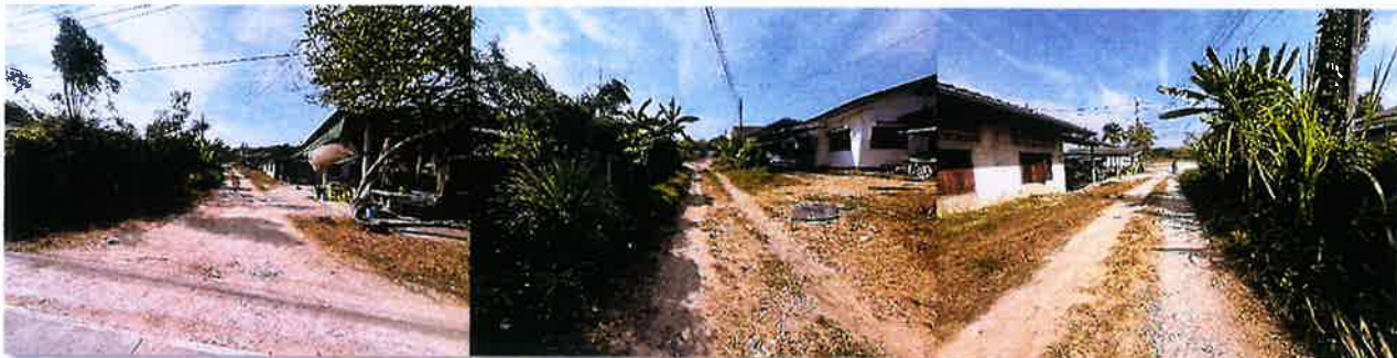
ระหว่างดำเนินงาน

งบประมาณ ๔๙๘,๐๐๐ บาท ระยะเวลาดำเนินการก่อสร้าง วันที่ ๑๑ กุมภาพันธ์ ๒๕๖๘ ถึงวันที่ ๑๑ เมษายน ๒๕๖๘ ณ.ชุมชนบ้านแหลมมะขาม หมู่ที่ ๒ ตำบลทับมา อำเภอเมืองระยอง จังหวัดระยอง โดยใช้งบประมาณ ๔๙๗,๐๐๐ บาท ก่อนดำเนินงาน