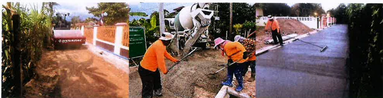
ดำเนินงานแล้วเสร็จ