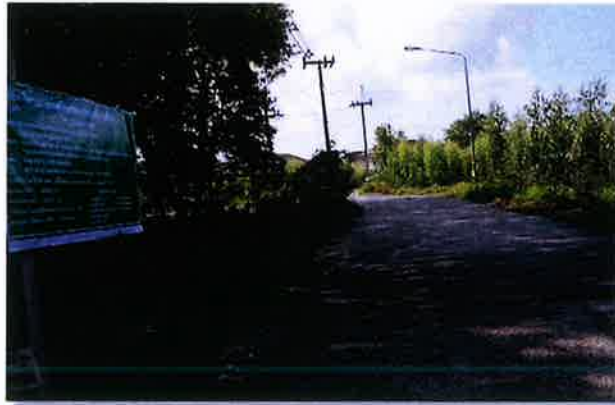
ระหว่างดำเนินงาน

งบประมาณ ๘๔๘,๐๐๐ บาท ระยะเวลาดำเนินการก่อสร้าง วันที่ ๒๘ มีนาคม ๒๕๖๘ ถึงวันที่ ๒๖ พฤษภาคม ๒๕๖๘ ณ.ชุมชนบ้านเขาไผ่ หมู่ที่ ๕ ตำบลทับมา อำเภอเมืองระยอง จังหวัดระยอง โดยใช้งบประมาณ ๖๔๓,๗๕๐ บาท ก่อนดำเนินงาน