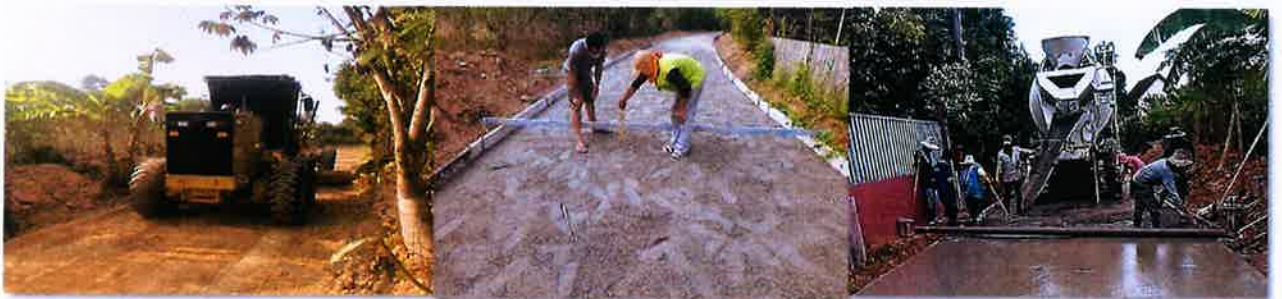
ดำเนินงานแล้วเสร็จ