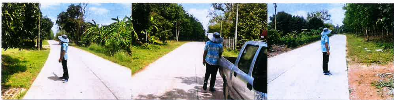
ระหว่างดำเนินงาน

งบประมาณ ๗๔๓,๐๐๐ บาท ระยะเวลาดำเนินการก่อสร้าง วันที่ ๒๗ มีนาคม ๒๕๖๘ ถึงวันที่ ๙ มิถุนายน ๒๕๖๘ ณ.ชุมชนบ้านเขาโบสถ์ หมู่ที่ ๗ ตำบลทับมา อำเภอเมืองระยอง จังหวัดระยอง โดยใช้งบประมาณ ๖๒๓,๐๐๐ บาท ก่อนดำเนินงาน