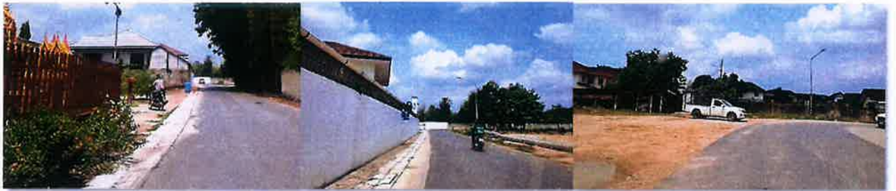
ระหว่างดำเนินงาน

งบประมาณ ๔๙๘,๐๐๐ บาท ระยะเวลาดำเนินการก่อสร้าง วันที่ ๒๗ มีนาคม ๒๕๖๘ ถึงวันที่ ๙ มิถุนายน ๒๕๖๘ ณ.ชุมชนบ้านทับมา หมู่ที่ ๔ ตำบลทับมา อำเภอมืองระยอง จังหวัดระยอง โดยใช้งบประมาณ ๔๗๐,๐๐๐ บาท ก่อนดำเนินงาน