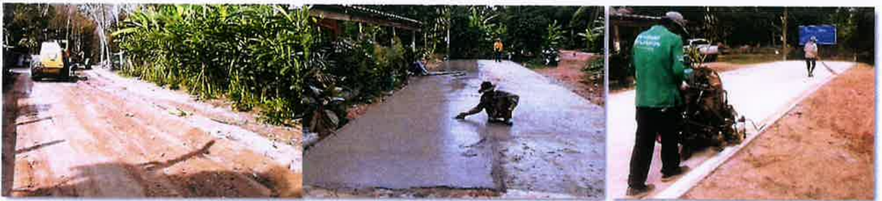
ดำเนินงานแล้วเสร็จ