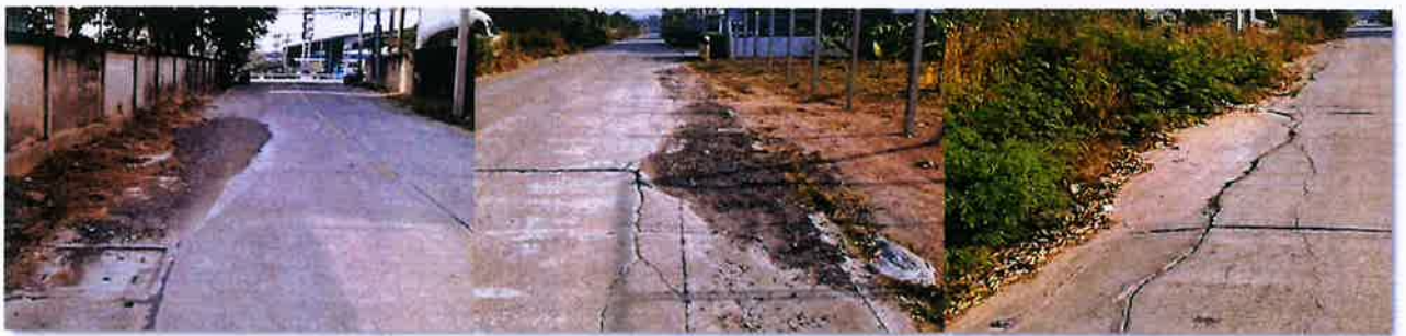
ระหว่างดำเนินงาน

งบประมาณ ๔๙๘,๐๐๐ บาท ระยะเวลาดำเนินการก่อสร้าง วันที่ ๒๘ มกราคม ๒๕๖๘ ถึงวันที่ ๒๘ มีนาคม ๒๕๖๘ ณ.ชุมชนบ้านทับมา หมู่ที่ ๔ ตำบลทับมา อำเภอเมืองระยอง จังหวัดระยอง โดยใช้งบประมาณ ๔๙๘,๐๐๐ บาท ก่อนดำเนินงาน